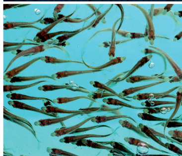
Postlarve ed avannotti